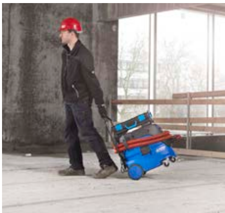
Robust und einfach handhabbar. Praktischer Transport und flexible Aufbewahrungslösung.