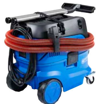
Kombinierter Schlauch- und Kabelhaken für einfaches und schnelles Aufbewahren und flexibler Riemen für Befestigung von Stromkabel, Schlauch, Zubehör und Werkzeugen.