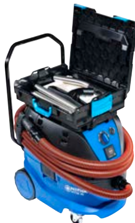
Optionale Aufbewahrungsbox für Zubehör, Ersatzfilter und/oder Staubbeutel.