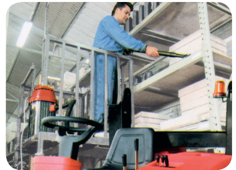
Optionaler on-board Staubsauger

Abbildungen können optionales Zubehör zeigen.